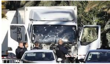
El Camion que mato 84 personas

Padre Nuestro - El Evangelio de hoy nos lleva a reflexionar sobre la oración del Padrenuestro, la oración perfecta porque fue el mismo Cristo quien la enseñó a sus discípulos y a toda su Iglesia, que la reza en todo el mundo en forma incesante. En las siete peticiones del Padrenuestro están contenidos todos los bienes. Los únicos y los verdaderos bienes que debemos pedir, y en el orden en que debemos hacerlo. Las tres primeras peticiones tienen por objeto la gloria de Dios: la santificación de su nombre, la venida del reino y el cumplimiento de la voluntad divina. Las otras cuatro peticiones presentan al Padre nuestros deseos: están referidas a nuestra vida, nuestro alimento y nuestra curación del pecado. Cuando decimos: Santificado sea tu nombre, estamos pidiendo la gloria de Dios por sí mismo. Es la mayor alabanza que podemos hacer al Creador, porque lo reconocemos como santo. Este es el primer bien que domina y contiene a todos los demás bienes. Con esta primera petición, el Señor nos enseña que debemos desear más la gloria de Dios, que cualquiera de nuestros intereses. En la segunda petición pedimos que venga a nosotros tu Reino.